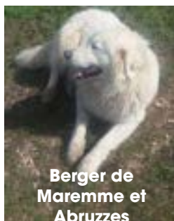
Berger de Mareme et Abruzzes