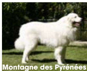
Montagne des Pyrénées